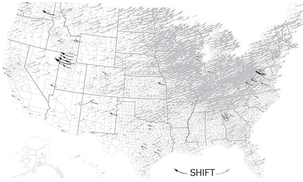
Figuur 1 Kiezers die van stem veranderden tussen de verkiezingen van 2012 en 2016

Daar komt nog bij dat racisme en xenofobie een sterke correlatie met economische achteruitgang lijken te hebben. Onderzoek van economen Rob Johnson en Arjun Jayadev, die economische achteruitgang tussen 1979