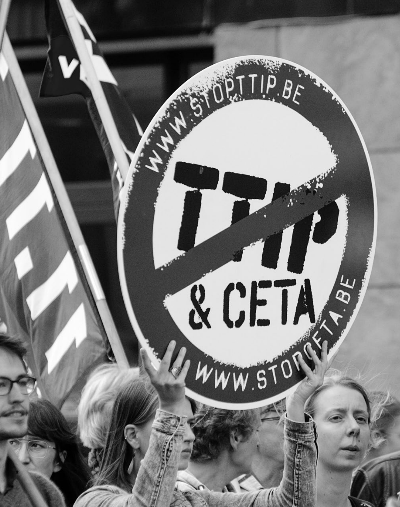
Tijdens de TTIP GAME OVER-demonstratie in Brussel op 20 september 2016 eisten de demonstranten onmiddellijke actie tegen vrijhandelsverdragen als TTIP, CETA en TISA.