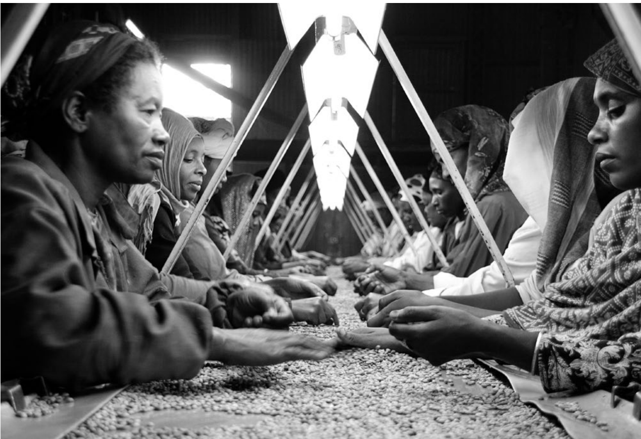
Addis Ababa, Ethiopië – Vrouwen scheiden de slechte koffiebonen van de goede. Heel Afrika verdient $2,4 miljard per jaar aan de koffieoogst, terwijl alleen Duitsland al ongeveer $3,8 miljard aan de wederuitvoer van koffie verdient.

teralisme blijven bestaan en discriminatie versterkt worden. In vrijwel elk land buiten de Verenigde Staten zou een gedetailleerde administratieve regulering van de uitvoer en invoer geen uitzondering zijn maar de regel worden. Onder deze omstandigheden zouden de Bank [Wereldbank] en het Fonds [IMF] vanzelf zinloos zijn; de verplichtingen die voor de landen die deelnemen aan het Europese herstelplan voortvloeien, zouden worden tenietgedaan; alle inspanningen om een vrijer handelssysteem te herstellen zouden mislukken.’ 18